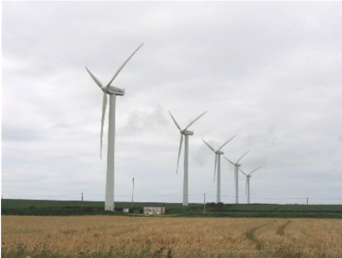
Parc éolien de Plouarzel dans le Finistère. Le petit bâtiment au pied de la première éolienne gère l'ensemble du parc. La puissance de chaque machine est de 660kW.

Résumé De tout temps l'homme a exploité le vent comme source d'énergie. La production d'électricité élargit le domaine d'application de cette énergie mais elle apporte une contrainte importante : une disponibilité permanente. Autrefois quand il n'y avait pas de vent, le meunier se reposait.