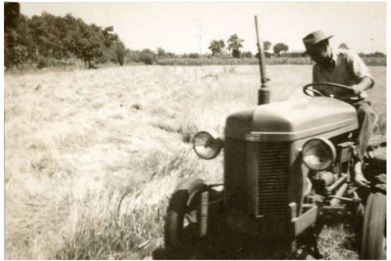
Chemin de Magonty, 1952

Faucheuse (dalhusa en gascon) à traction animale L'organe de coupe est une lame dentée, animée d'un mouvement de va et vient dans le porte-lame, garnie de doigts qui divisent la récolte en petites touffes. Au repos, comme sur la photo, le porte-lame était relevé contre le bâti.