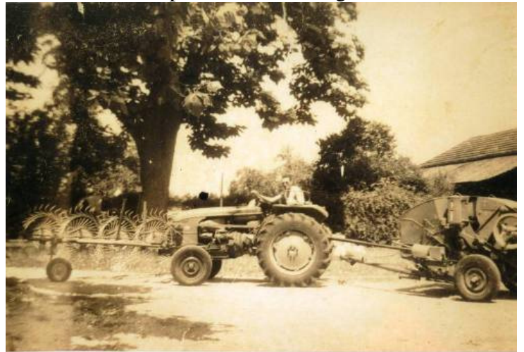
Chemin de Magonty, années 1950

Tracteur avec "ratoir" et presse à fourrage Râteau ou râteau faneur, outil servant à rassembler le foin. Il se compose de peignes que des tambours entraînent dans un mouvement tournant. La presse servait à comprimer le foin ou la paille en ballots réguliers.